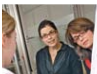
Lernen im Sommer